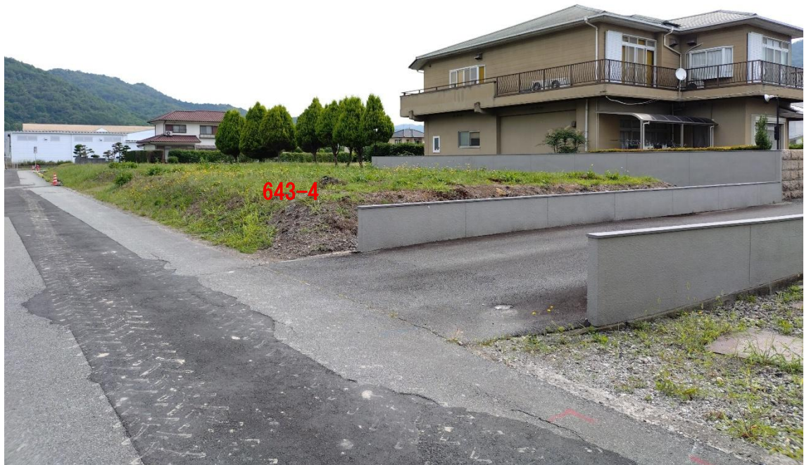
現況写真（北西から撮影）