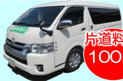
市川町買い物バス「ひまりん号」